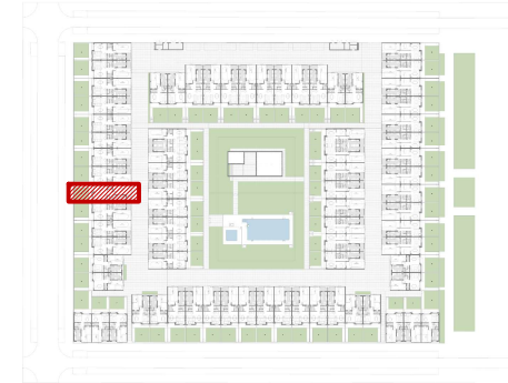
ESQUEMA DE DISTRIBUCION